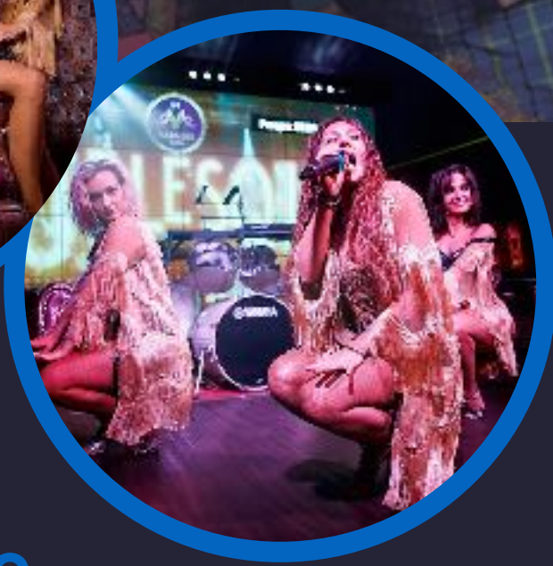
ТАНЦЕВАЛЬНО- ВОКАЛЬНЫЙ КОЛЛЕКТИВ HAVANA GIRLS

Коллектив который создаёт настроение с первого появления на сцене! Программа из нескольких танцевальных номеров, яркие костюмы и вокальные номера которые понравятся даже искущённым зрителям